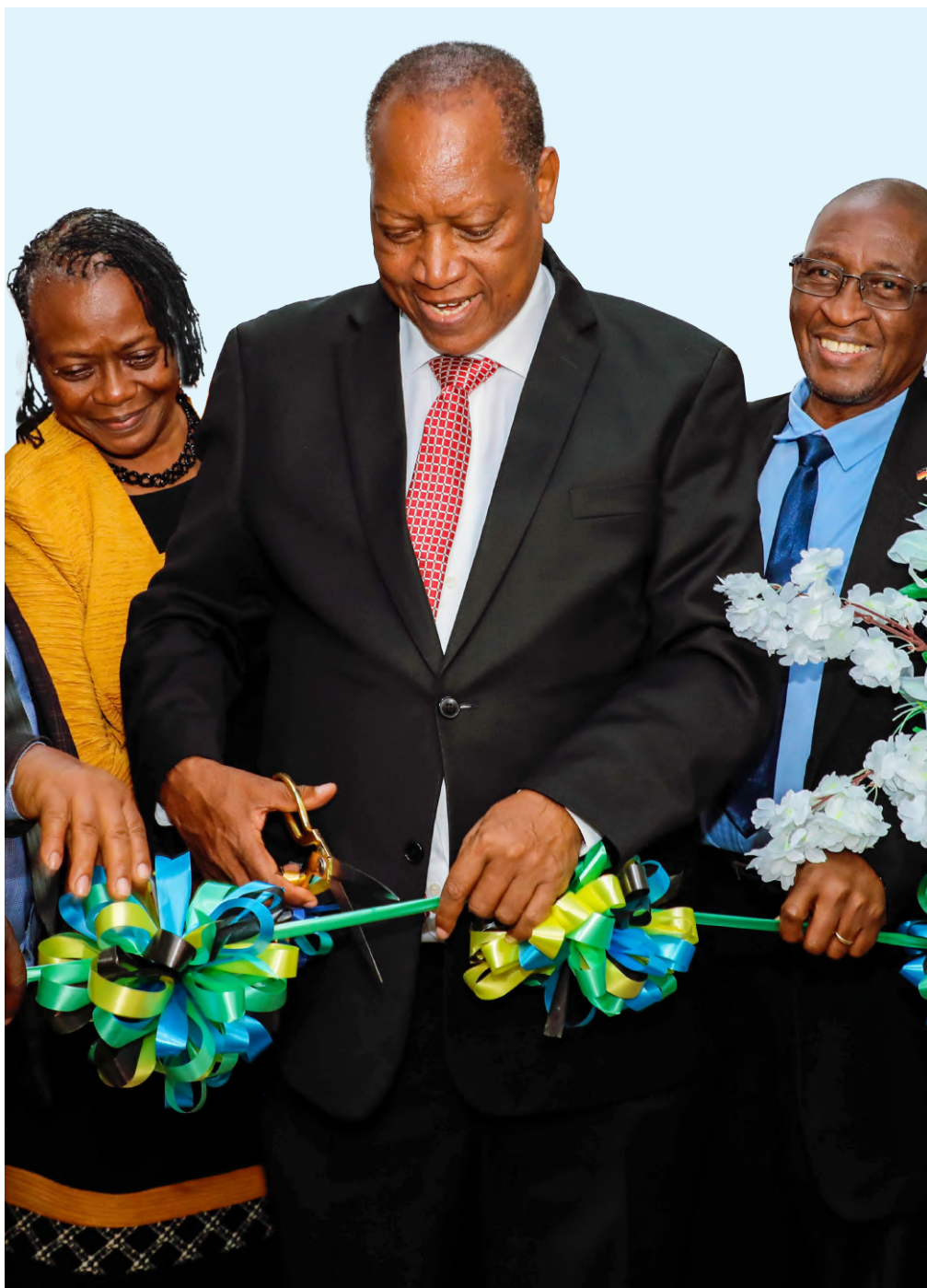
Waziri wa Katiba na Sheria Mhe. Prof. Palamagamba John Kabudi akikata utepe ikiwa ni ishara ya kuzindua rasmi Kituo cha Huduma kwa Mteja. tarehe 05 Septemba, 2024 Mtumba Jijini Dodoma.

Katika hafla ya uzinduzi huo, Prof. Kabudi amevitaka Vyombo vy Habari Nchini, kuendelea kuibua malalamiko na changamoto za Wananchi zinazohusiana na masuala ya Kisheria ili ziweze kushughulikiwa. Prof. Kabudi amesema kuwa, Vyombo vya Habari vimekuwa msaada mkubwa kwenye Jamii kwani vimekuwa vikitoa elimu kwa Wananchi ya namna wanavyoweza kutatuliwa changamoto zao.