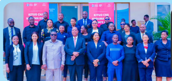
Waziri wa Katiba na Sheria na, Naibu Waziri wakiwa katika picha ya pamoja na Watumishi wa Wizara.